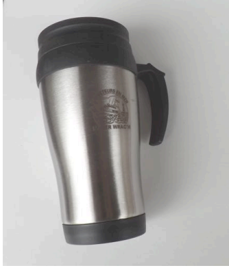
Mug Isotherme 400ml