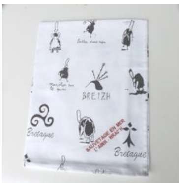
Torchon décor breizh