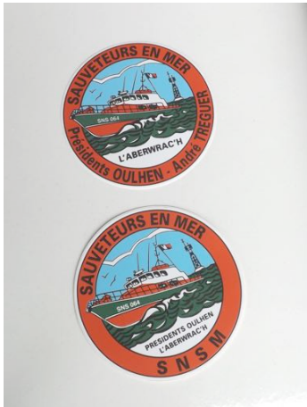
Autocollant Ø 10cm