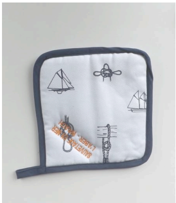
Manique décor nautique