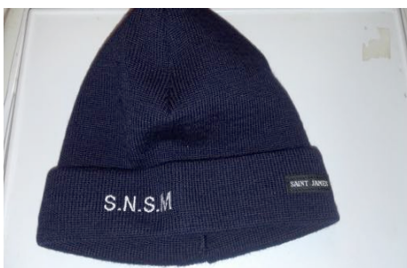
Casquette adulte réglable