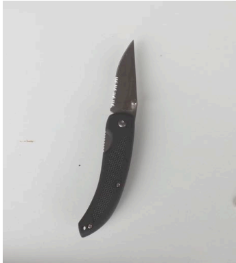
Couteau loup de mer lame 7 cm