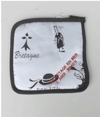
Manique décor breizh