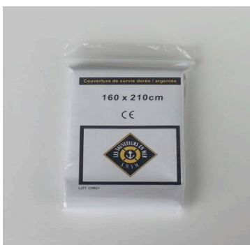
Couverture de survie 160 x 210 cm