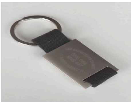
Porte clef flottant